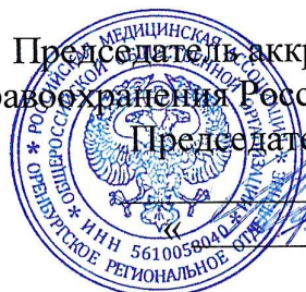
График проведения первичной специализированной аккредитации специалистов в ФГБОУ ВО ОрГМУ Минздрава России на июль 2024 года